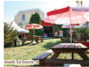
Snack "La Source"