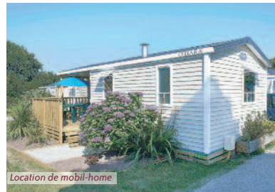
Location de mobil-home