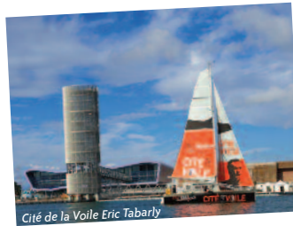
Cité de la Voile Eric Tabarly

02 97 33 71 28 www.campingdelafontaine.fr