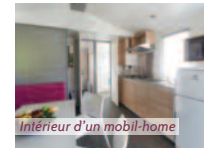
Intérieur d'un mobil-home